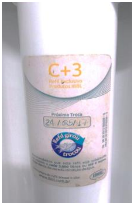
Foto Demonstrativa do Refil do Filtro Utilizada no Pronto Socorro.